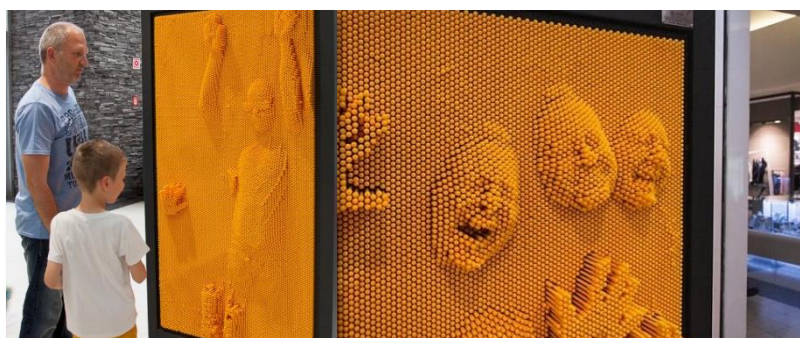
Obtisk lidského těla - vytváření kopie zábavnou formou

Návštěvník obtiskuje své tělo nebo jeho části do matice bodů na posuvných tyčkách a vytváří tak "3D" kopii svého reliéfu.