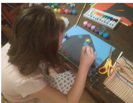
Obr. 3: Výroba domečku v trubičkami v hodině výtvarné výchovy.

Poznámka: Trubky a domečky si děti mohou samy vytvořit v hodinách pracovních činností a výtvarné výchovy, hru na molekuly lze zařadit do hodin tělesné výchovy, čímž dochází i k propojenosti předmětů mezi sebou.