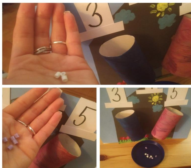
Obr. 2: Pomůcka na sčítání – pracovní domeček – v akci.

4) Výsledek zapíšou do pracovního listu.